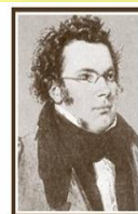
Associazione Culturale "F. Schubert"

L'ASSOCIAZIONE IDEE E CULTURA DI PECETTO, IN COLLABORAZIONE CON L'ASSOCIAZIONE CULTURALE FRANZ SCHUBERT DI TORINO, VI INVITANO